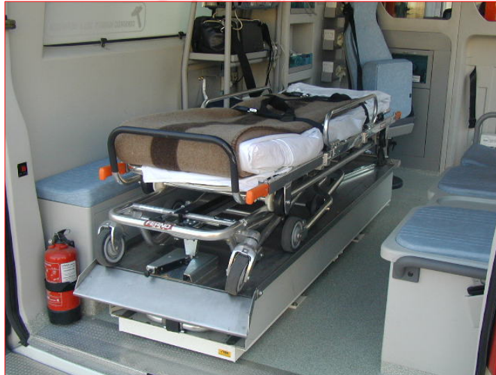
Corso formativo PSTI per i Volontari della Croce Rossa Italiana