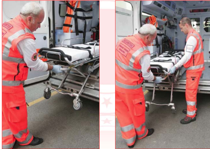
Corso formativo PSTI per i Volontari della Croce Rossa Italiana