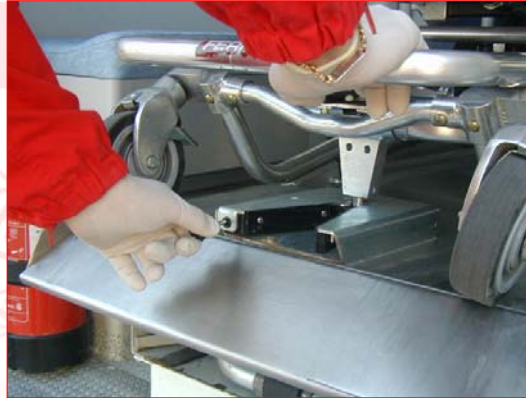
Corso formativo PSTI per i Volontari della Croce Rossa Italiana

ESISTE SEMPRE un FERMO che impedisce alla barella di muoversi durante il tragitto in ambulanza.