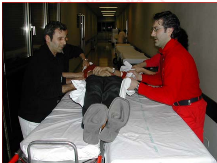
Corso formativo PSTI per i Volontari della Croce Rossa Italiana