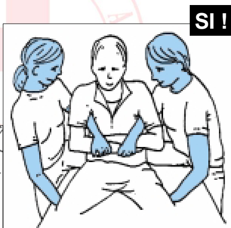
Corso formativo PSTI per i Volontari della Croce Rossa Italiana