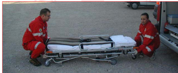
Corso formativo PSTI per i Volontari della Croce Rossa Italiana

Per ABBASSARE la barella, i due soccorritori si posizionano uno alla testa ed uno ai piedi. Deve essere SGANCIATI I FERMI che blocca le gambe (ci sono DUE LEVE : testa e piedi).